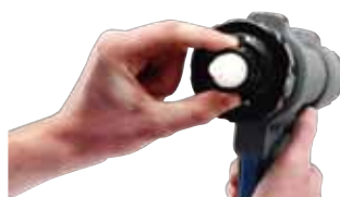
写真の部分を回すと、ビード状とスプレー状、両方施工が可能です