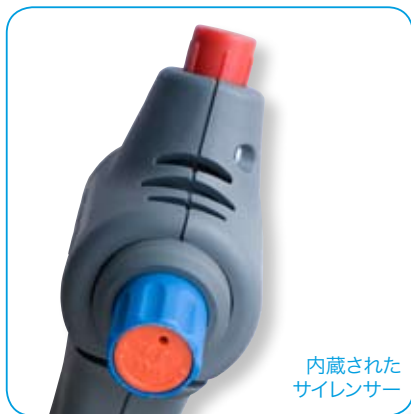
内蔵されたサイレンサー

エアの流れをハンドル部分に設置されたつまみのワンタッチ操作で調節可能です。その結果、低粘度から高粘度まで様々な材料をカートリッジ・フィルムバックで簡単に施工できます。